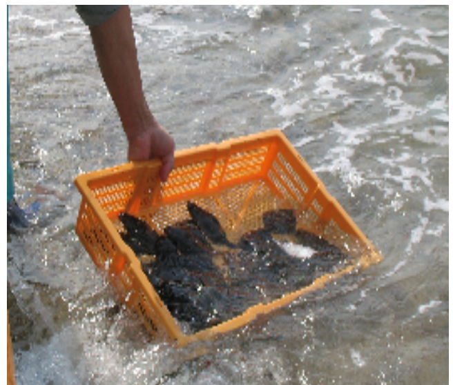
ヒラメ稚魚の放流

また、本協会では放流効果をより一層高めるために、漁業者・漁協・関係機関と連携し、資源管理型漁業の推進に努め、漁船漁業の活性化と漁業生産の増大に努めています。放流効果実証事業の一環として、 平成20年度からヒラメの移動・分布調査を実施しておりますので、標識の付いたヒラメを発見された方は（社）香川県水産振興協会（TEL087-811-7738）、または香川県水試（TEL087-843-6511）にご連絡をお願いします。ヒラメの大きさに関係なく1尾5,000円で買い取ります（平成22年12月末日まで）。 また、平成22年度もクルマエビ放流効果調査を継続いたしますので、併せてご協力をお願いします。