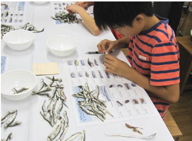
イリコモンスター選別体験をする参加小学生

その後、各々に配布された選別されていないイリコの中から、イリコモンスターの選別体験を行いました。イカやタコ、タチウオの稚魚を見つけたり、サバやアジ、ママカリなど見分けが付きにくい魚に苦戦しながらも選別体験を楽しんでいました。