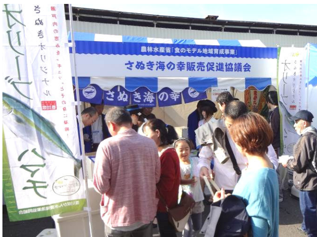
築地市場祭りでオリーブハマチの試食

11月2日にはFish-1グランプリ in 築地市場祭りに参加してきました。市場移転を2年後に控え、築地最後の市場祭りということもあり、この日の来場者数はなんと約10万人ということで、大変盛り上がり上がっていました。私たち海の幸協議会はオリーブハマチ(ソテー)の試食を行いました。試食はすぐになくなるほどで、多くの来場者の方々に味わっていただけました。おさかなシャトルも大人気でした!!