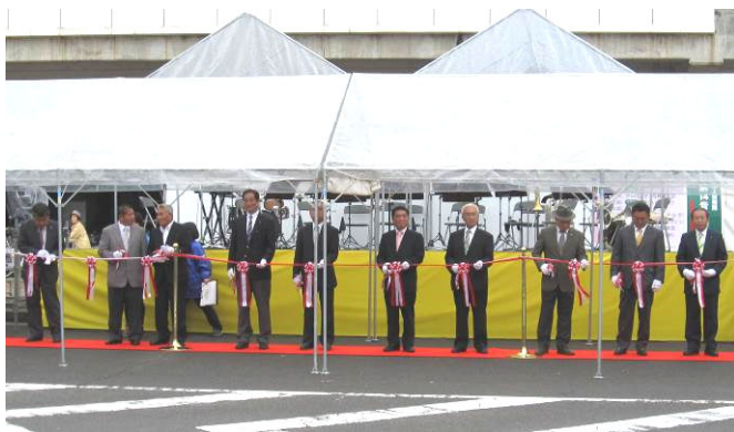
主催者テープカット

11月1日(土)、中讃海域漁業・漁村活性化協議会(事務局:多度津町産業課)が主催の第12回中讃秋のぴちぴちとれたて市がJR宇多津駅前南口広場で開催されました。