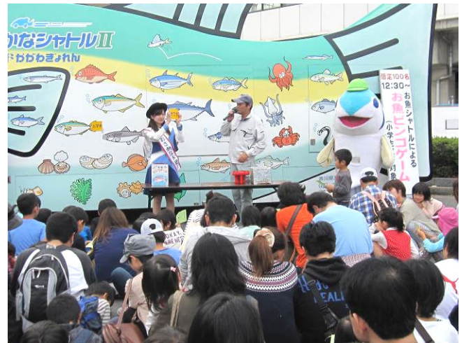
大人気のシャトルイベント

また、「お魚ビンゴゲーム」のお魚シャトルイベント、お魚タッチプールによるアジのつかみ取りなどが開催され大盛況のうちに終了しました。