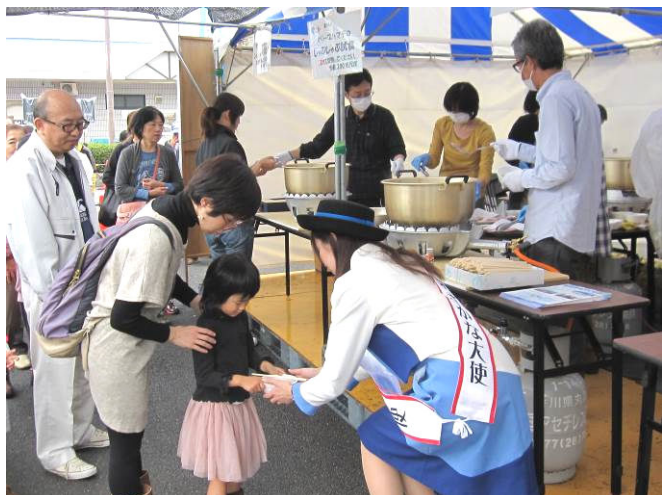
行列のできたオリーブハマチしゃぶしゃぶ試食会

本会からは、加工事業部がイリコや生鮮加工品を出店したほか、限定200食のオリーブハマチのしゃぶしゃぶ試食会も行い、開始後わずか40分も経たずに完食となり、大変好評でした。