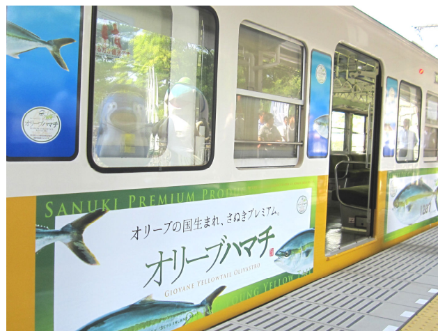
オリーブハマチラッピング電車の運行