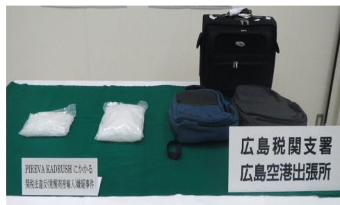
リュックサック内に覚醒剤を隠匿！

密輸フリーダイヤル 0120- シロイ 461- クロイ 961（24時間365日受付）