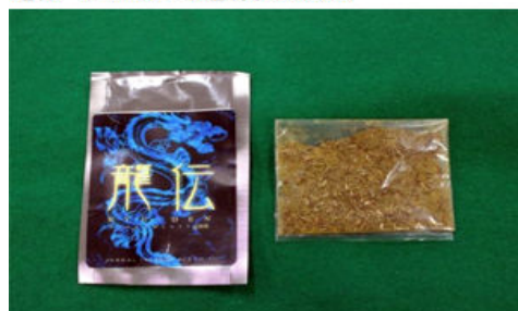
通称“4-MMC”を含有する植物片