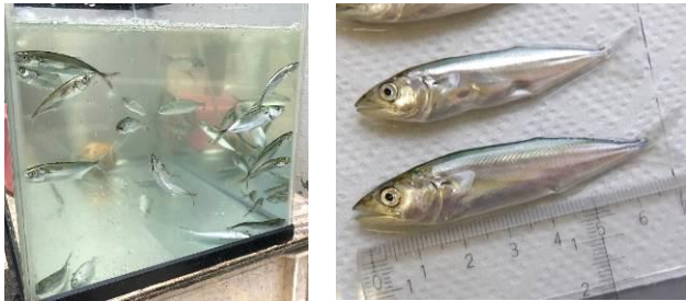
放流されたサワラの稚魚

全長約7.7cmまで中間育成されたサワラの稚魚およそ2万8千尾を中間育成施設から囲い網で追い、直接海面へ放流しました。