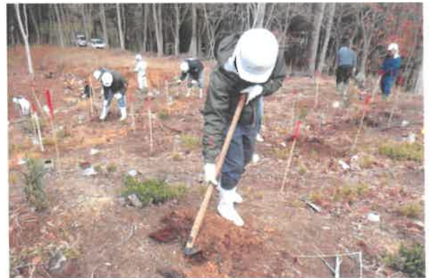
植樹作業に取り組む参加者

新型コロナウイルス感染症防止のため、来賓の招待は最小限とする等、規模を縮小しての開催となりましたが、瀬戸内海に漁業者の森からの栄養塩が供給され、豊かな漁場が形成されることを願ひながら各自作業に取り組みました。