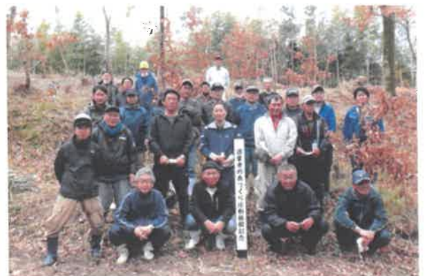
漁業者の森づくり活動標柱を囲み記念撮影

今後の作業については、クヌギ苗木が順調に成長するように、笹竹や雑木の伐採やクヌギ苗木の補植を定期的に行う予定です。