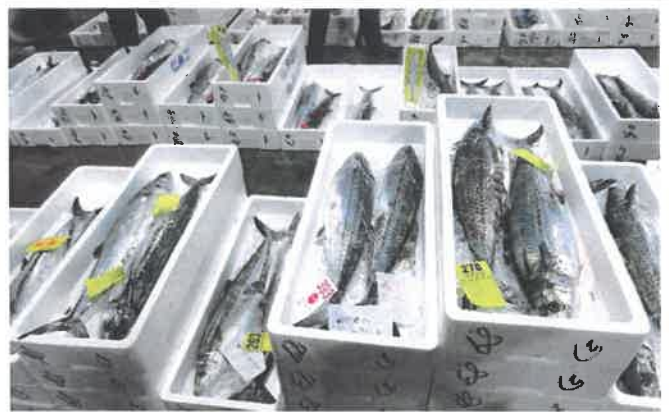
市場に並んだサワラ

4月21日(木)瀬戸内に春を告げる県産サワラの初競りが高松市中央卸売市場にて行われました。初物の入荷量は2,108匹で、豊漁だった昨年より1,789匹少なかったものの、最高値はご祝儀相場で、1kg当たり4万円の値が付き、新型コロナウイルスの影響で冷え込む市場は活気に溢れました。市場に並んだサワラは体長80cmの3年物が中心で、4~5kgの大きめのサイズが多かったことから、平均単価は1kgあたり1,122円と昨年より440円高くなりました。