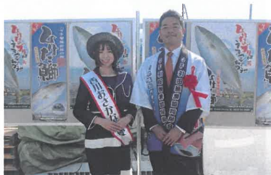
東かがわ市長上村一郎様と記念撮影