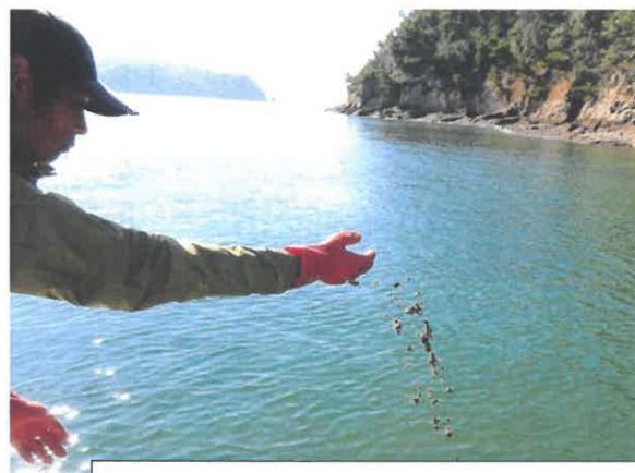
アマモ種子の播種を行う漁青連部員